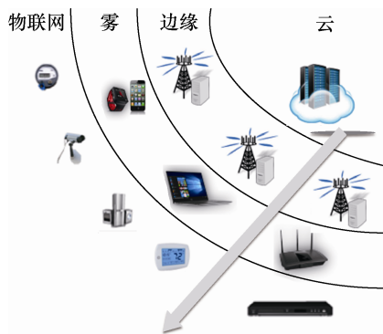
图 3 云—雾—边缘协作计算

云计算中，计算功能、存储功能和网络管理功能统一集中在“云端”，以支撑资源受限终端的正常运行。然而，较长的传输时延一直是云计算的重要缺陷。移动边缘计算（MEC, mobile edge computing）由欧洲电信标准协会提出，并被定义为一个无线接入网络中在移动用户近端为其提供计算能力的边缘节点，如基站或接入点。雾计算（FC, fog computing）作为 MEC 概念的一般形式由思科（Cisco）公司提出，其中，对边缘设备的定义也更加广泛了，从智能手机到机顶盒等。物联网设备是资源受限的，但大量闲置的设备可以为实时任务处理提供充足的计算资源。如图 3 所示，云—雾—边缘协作计算通过将云、雾、边缘计算资源融合、统一调度，从而为 E-MUSE 各层提供无处不在的、满足任务需求的计算能力，以支撑 E-MUSE 不同功能的具体实现，如泛在互联中数据的交互、泛在融合中数据的融合、泛在智慧中数据的处理。